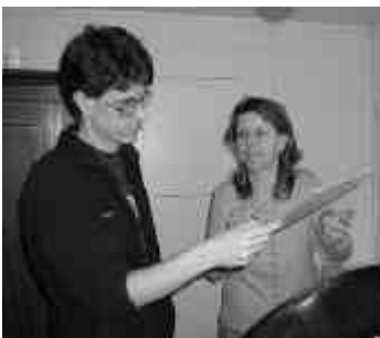
Was söu das heisse...?

Nun, statt viele Worte über den Samstag zu verlieren, lassen wir doch ein paar Fotos sprechen: