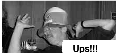
Das isch ne gsi, dr Äntetanz!

Müde, aber zufrieden, liessen wir uns gegen 2 Uhr morgens in die Kissen fallen. Am Sonntag spielten wir das ganze Repertoire durch, bevor wir uns an den Mittagstisch setzten. Wir genossen noch einmal die gute Kost und liessen es uns gut gehen. Einige von uns brauchten anschliessend noch ein Verdauungsnickerchen, dann standen wir erneut hinter die Instrumente und hatten Wunschkonzert.