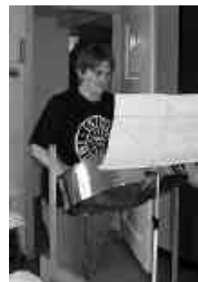
Nid frage, schpile!