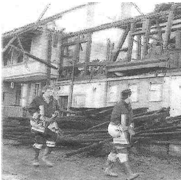
90 Feuerwehrleute standen im Einsatz.

Zur baldigen Geburt des 3. Kindes und für die Zukunft von Herzen alles Gute! No Panique